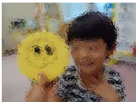
タンバリンでお月さまを作ったよ♪