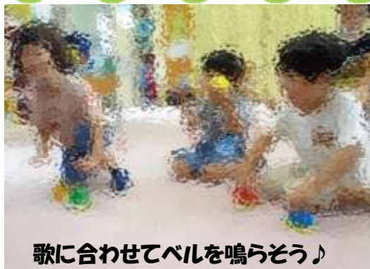
歌に合わせてベルを鳴らそう♪