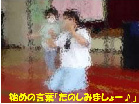
始めの言葉「たのしみましょー♪」

9月8日(木)に芸術鑑賞会を行いました。劇団【デフパペットシアターひとみ】がワークショップに来てくださいました。春・夏・秋・冬をパペットや道具を使いながら表現していました。幼稚部の子どもたちもパペットを使わせてもらったり、楽しそうにカマキリの真似をしたりしていました。