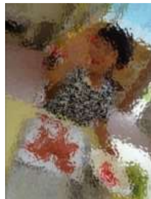
<ちょきちょき、ぺったん> 秋の木と落ち葉を作ったよ!